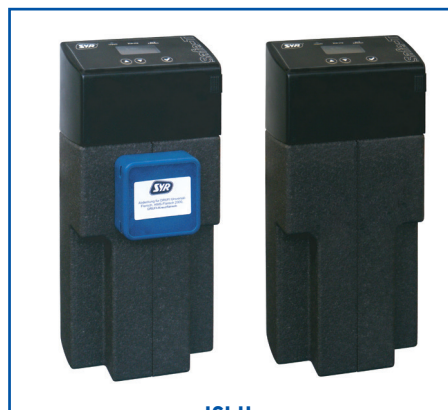
ISI Home: Safe-T Connect Master und Slave